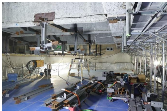
文京シビックセン ター議場特定天井 (耐震)