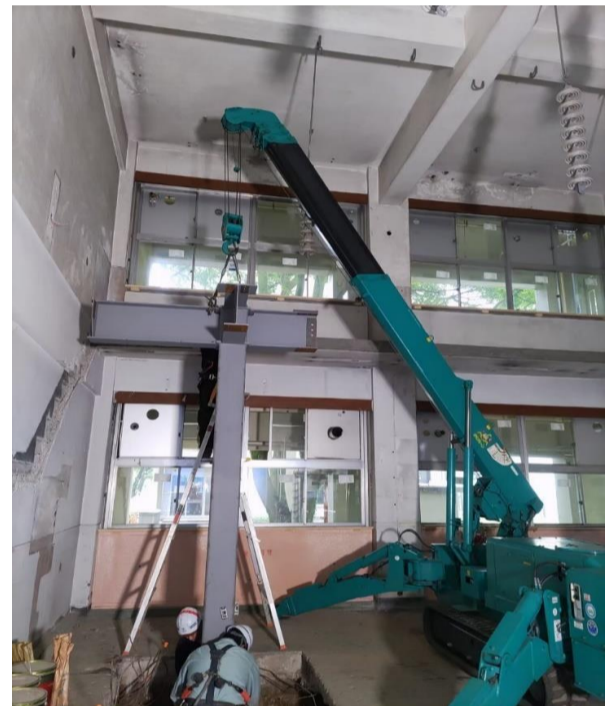
東京農工大学 (内部鉄骨)