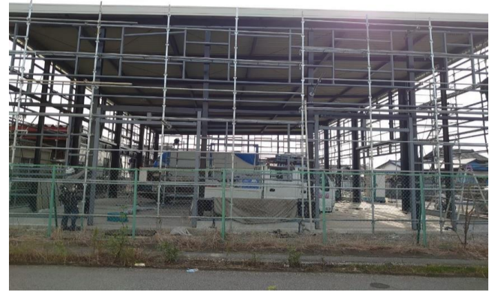
リバイバルサービス (倉庫)