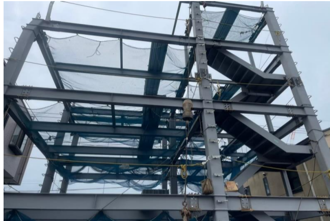
清水ビル新築工事 (事務所)