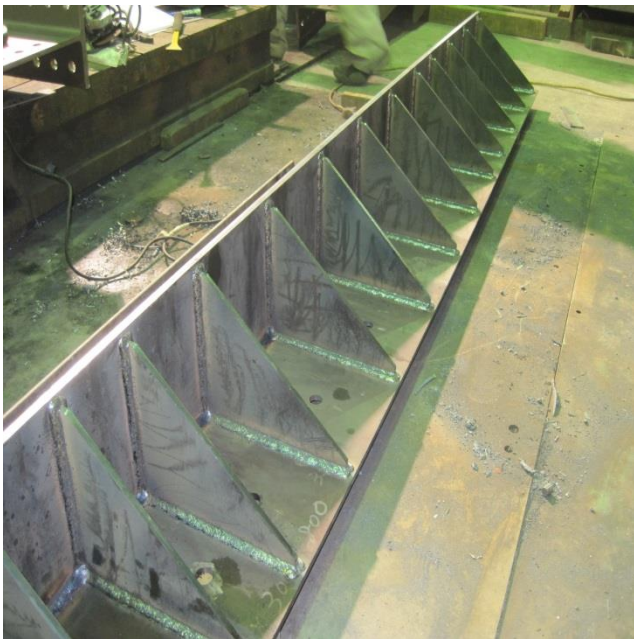
銀座ビル EV 敷居