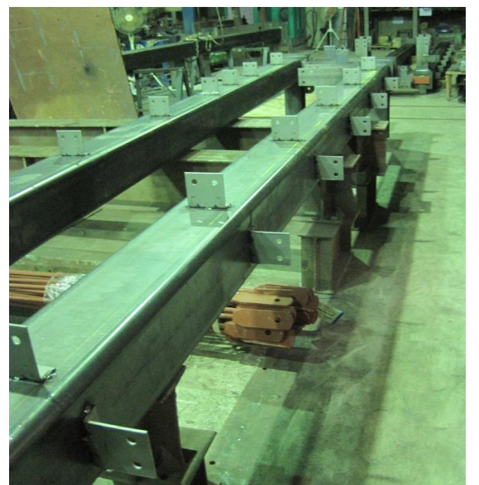
電元社製作所増築工事