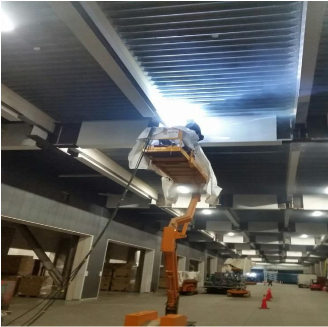
ランドポート厚木工事